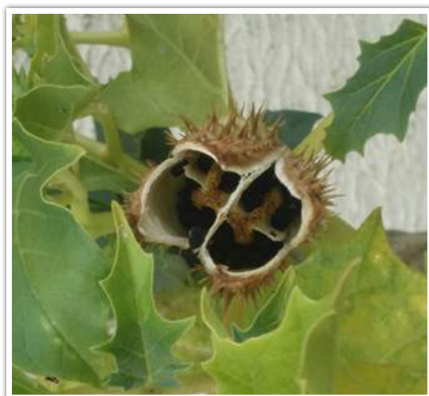
Photo de fructification de datura, prise le 31 août en Ille et Vilaine

Il est rappelé que l'ensemble de la plante est toxique et que toute consommation doit absolument être évitée. La présence de trois puissants alcaloïdes (hyoscyamine, scopolamine, atropine) rend la plante particulièrement dangereuse.