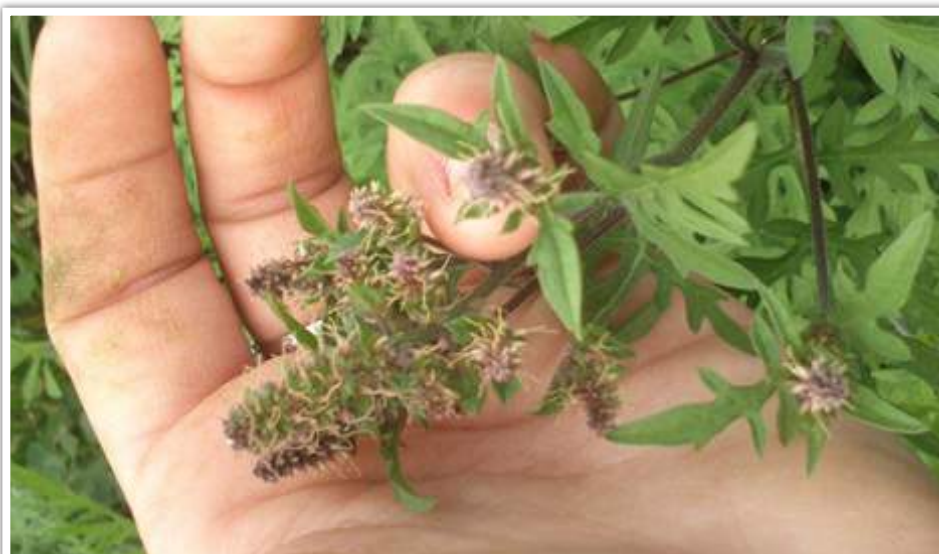
Photo de plant d'ambroisie à feuilles d'armoise, début de fructification, 9 août 2017, dans le Morbihan