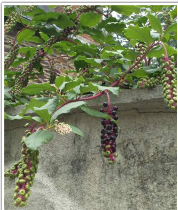
Photo de fructification de raisin d'Amérique, 5 septembre 2017, en Ille et Vilaine

Le raisin d'Amérique ou phytolaque a atteint son développement maximum.